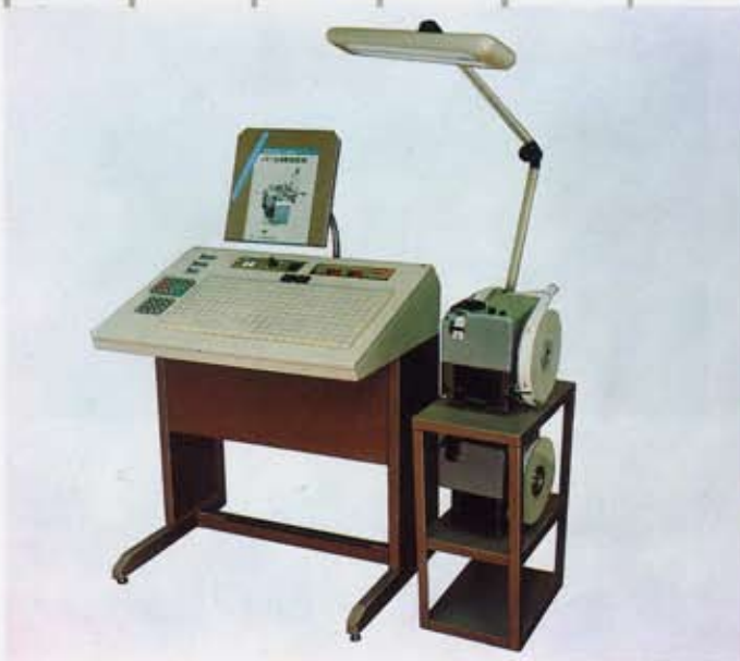
■ 外字も含めたキーボード